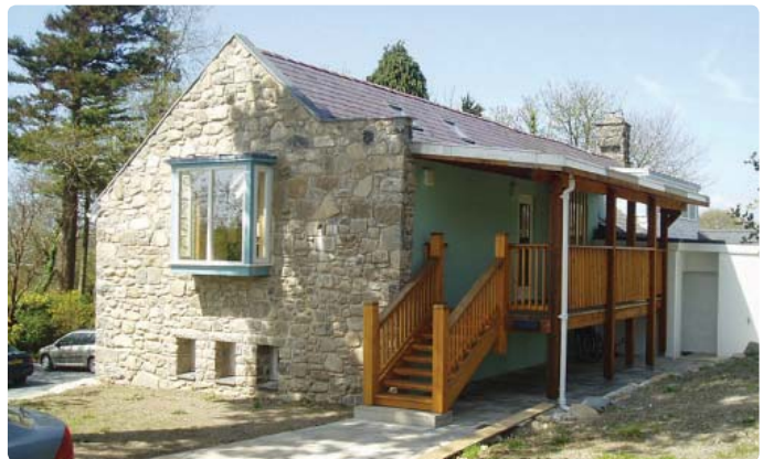
Canolfan Ysgrifennu Tŷ Newydd