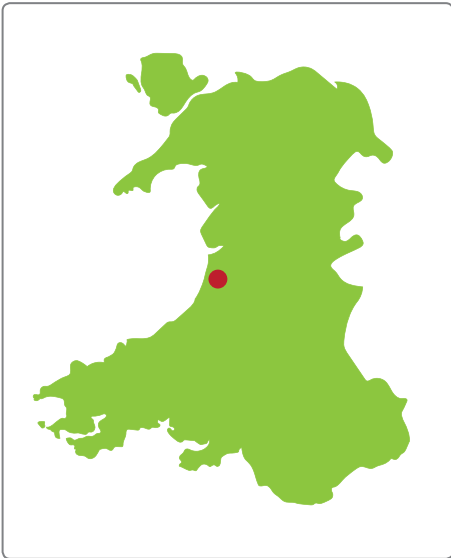
Canolfan y Celfyddydau, Aberystwyth