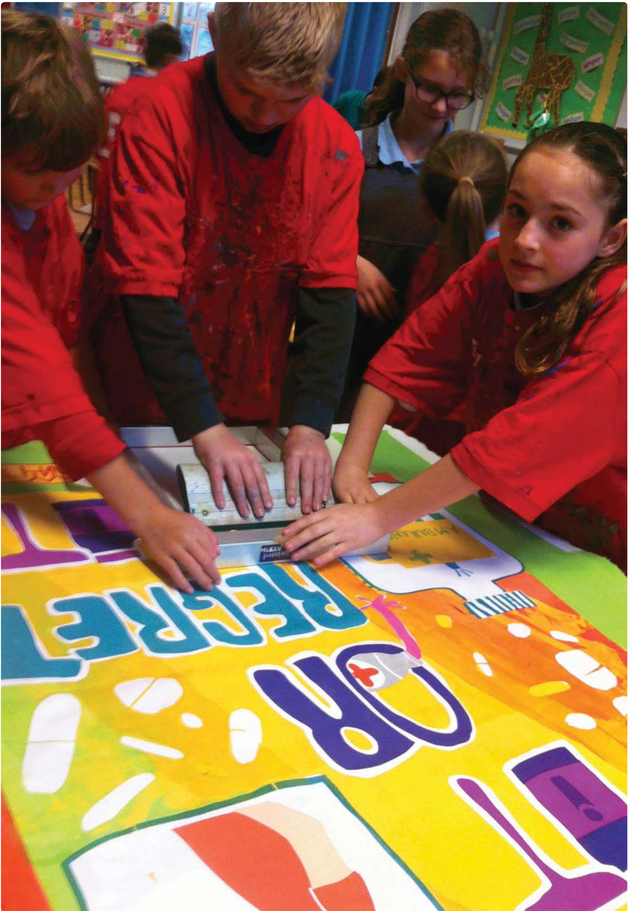
Prosiect ysgol, Artis Cymuned