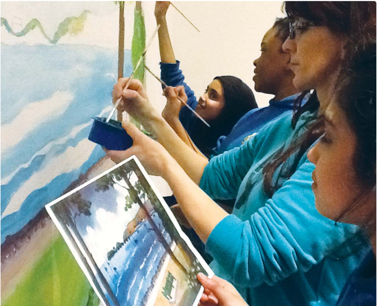
Plant Ysgol Gynradd Hafod yn peintio murlun mewn cartref nyrsio lleol