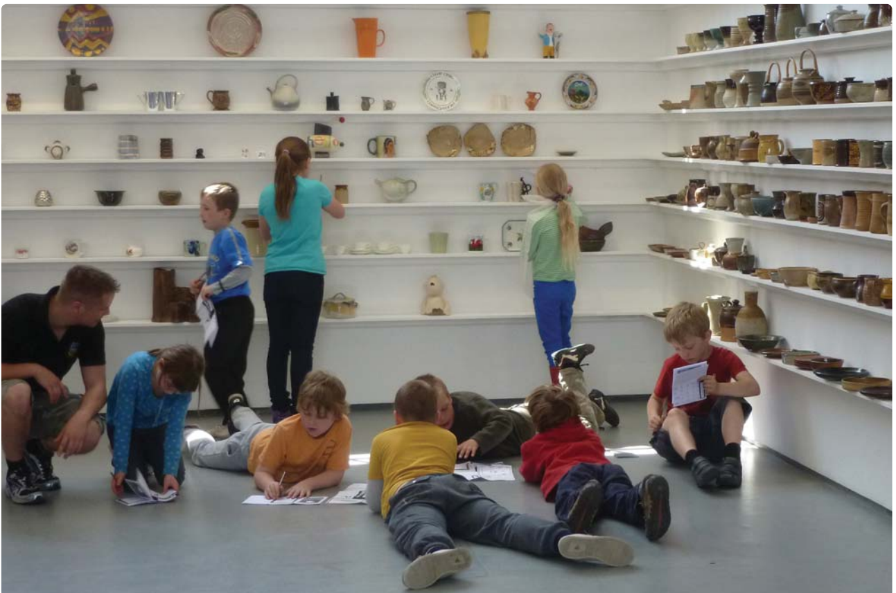
Ymweliad ysgol i Oriol Myrddin