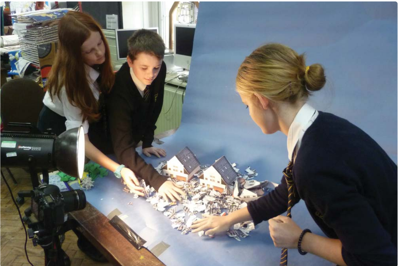
Gweithdy animeiddio Ffotogallery, Ysgol Stanwell, Penarth