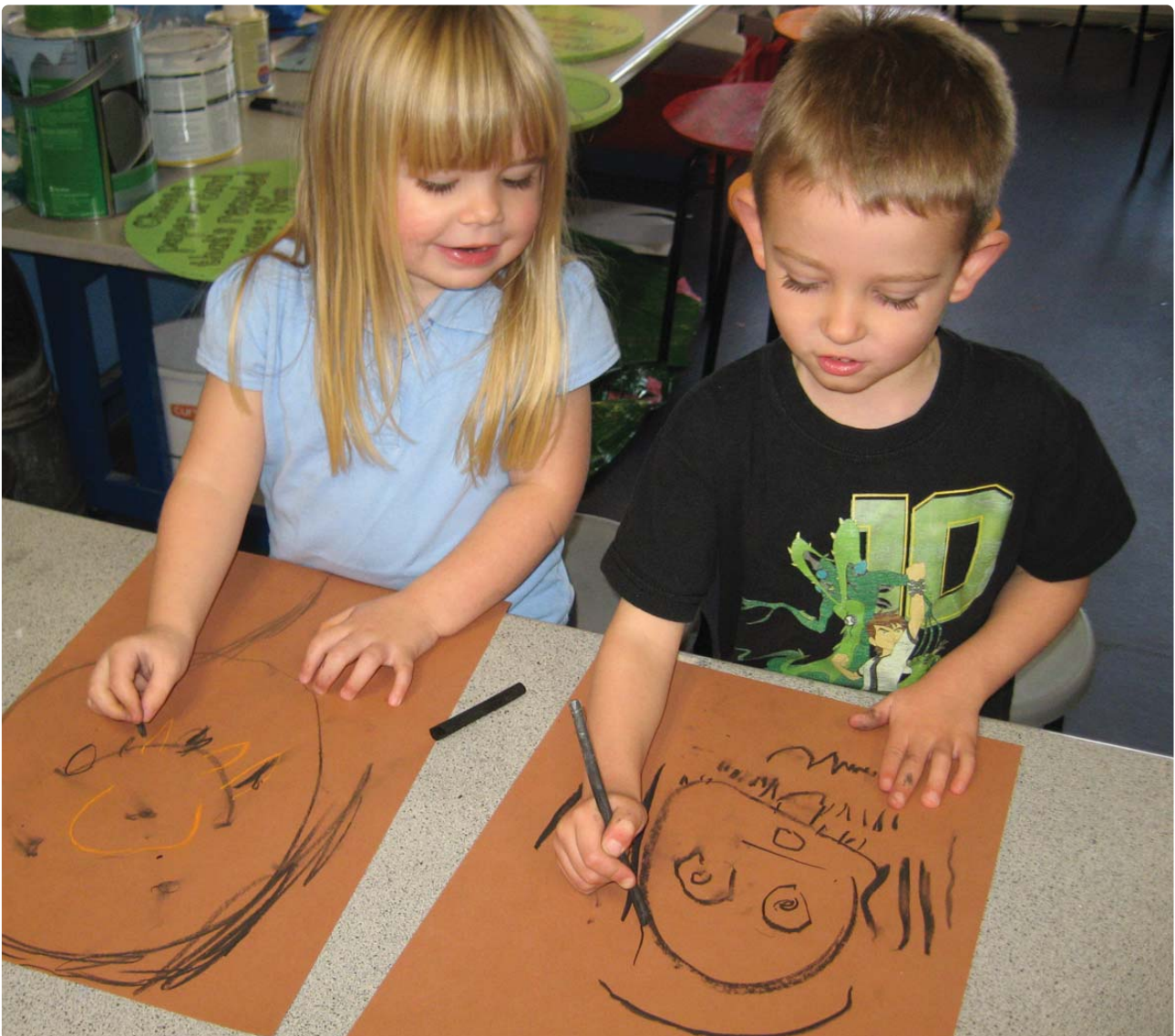
Plant Ysgol Gynradd Hafod yn astudio cerfluniaeth ac arlunio â siarcol

cefnogi'r rhaglen yn llwyr. Byddwn yn gofyn iddynt enwebu aelod o staff (pennaeth adran neu aelod o'r uwch dîm rheoli fyddai orau) i gyflawni rôl Hyrwyddwr Creadigrwydd a'r Celfyddydau yn yr Ysgol . Yr unigolyn hwn fydd y cyswllt rhwng yr ysgol a'r cyfleoedd sydd ar gael drwy'r rhwydwaith rhanbarthol. Bydd yn helpu ei ysgol i nodi blaenoriaethau o ran addysg y celfyddydau, ac yn sicrhau bod ei ysgol yn ymwybodol o arfer gorau ac yn gallu manteisio i'r eithaf ar fynediad gwell i gyfleoedd celfyddydol a chreadigol.