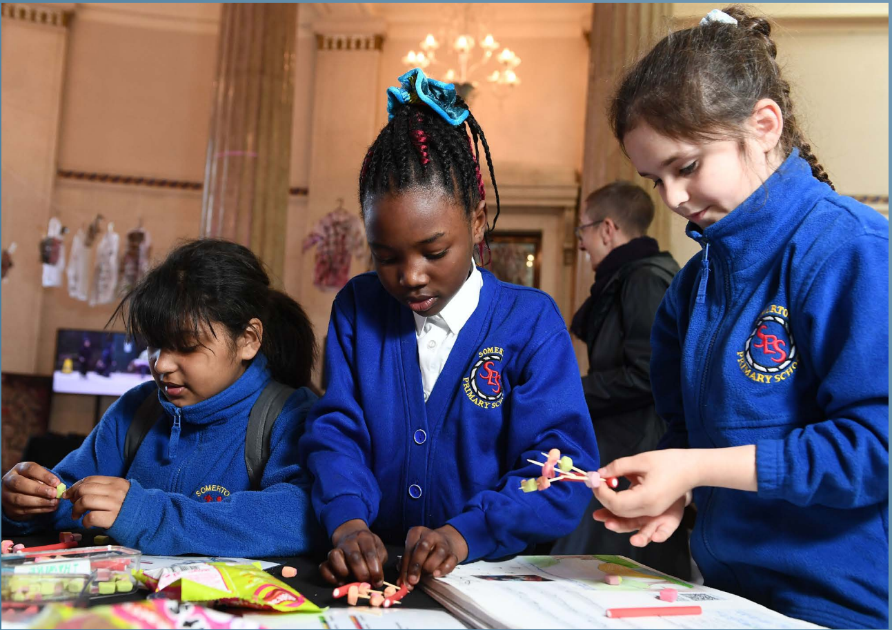
Ysgol Gynradd Somerton, digwyddiad Dewch i Ddathlu!, Dysgu creadigol drwy'r celfyddydau